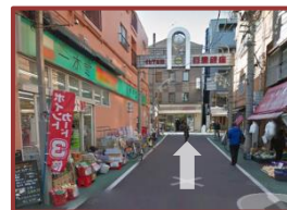
⑤ためらわずにさらにまっすぐと・・・