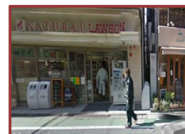
⑥突き当りのナチュラルローソンさんを右折