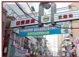
③そのまま目黒銀座をまっすぐに進みます