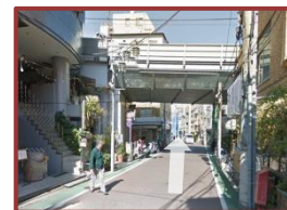
⑦東横線のガードをくぐってその先まもなく