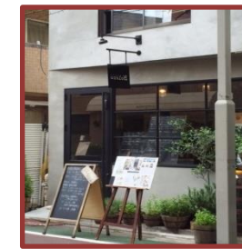
⑧ガードの先、右手側3軒目がボレロ ごゆっくりお楽しみください！