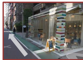
④5分ほどで右手側にパティスリーポタジェさん まだまっすぐです