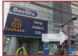
②1分ほどでTSUTAYAさんが見えますので 手前を右方向へ